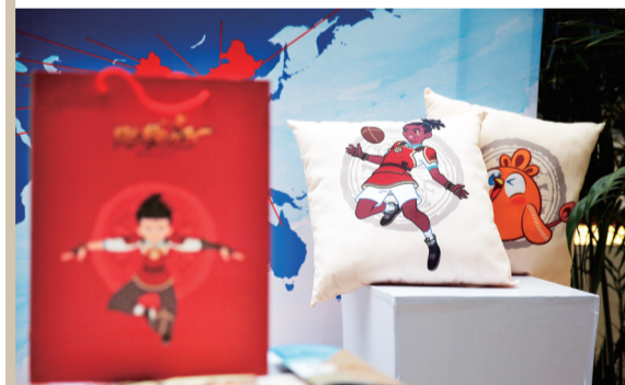
9月11日,临淄区《蹴鞠小子》大型动漫发布会会场外的动漫产品展示。