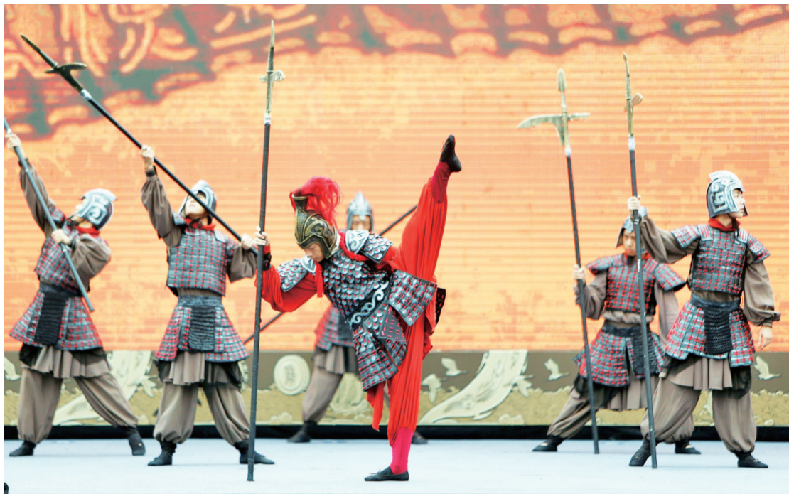
9月12日上午,第十六届齐文化节开幕式上,由山东理工大学带来的歌舞《太公颂》。