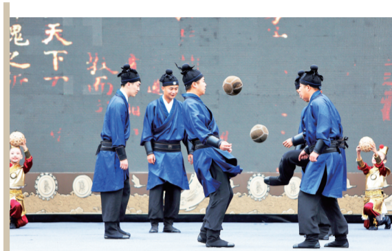
9月12日上午,第十六届齐文化节开幕式上,演员们用舞蹈的形式演绎《千年蹴鞠》。