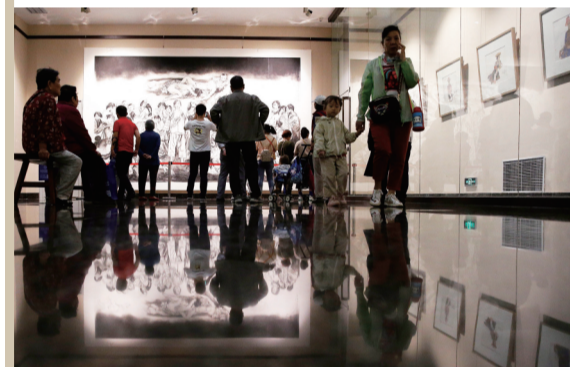
精彩的展览、精美的展品,给观众带来一道道文化大餐。