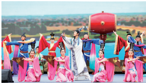
9月12日上午,第十六届齐文化节开幕式上的开场舞《齐风韶韵》。

齐文化作为齐鲁文化的重要组成部分和中华文化的重要源头,是淄博凤凰涅槃、加速崛起的宝贵文化滋养和精神动力,大力弘扬和传承齐文化是使命使然,亦是担当所在。