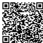
扫描二维码查看现场视频。