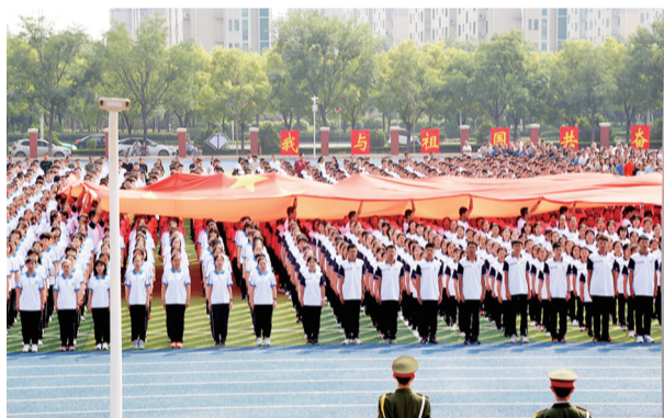
巨幅国旗在人群中传递。

据悉，9月份淄博市各级团组织将集中开展“我与祖国共奋进——国旗下的演讲”特别主题团日活动，通过“沉浸式”的仪式教育，激励和引导广大团员青年大力弘扬以爱国主义为核心的伟大民族精神，进一步坚定“四个自信”，为实现中华民族伟大复兴的中国梦而奋斗。