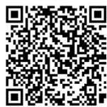
扫描二维码查看现场视频。

么要拿走别人车钥匙，又为什么要打开我的后备厢。”车主为此非常困惑，想不通拿走车钥匙的人为何要这样做。