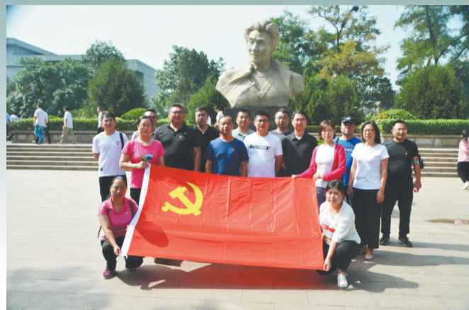
邮储银行临淄区支行党支部全体党员参观焦裕禄纪念馆。

行业影响力。不断加强基层党组织建设，组织全体党员参观焦裕禄纪念馆，开展“不忘初心，牢记使命”主题党课，增强党员的责任意识、担当意识。党员牢记使命，发挥党员模范带头作用，以实际行动立足本职岗位，努力做好各项工作，全力开创“服务于地方经济，员工受人尊重，企业健康发展”的新局面。