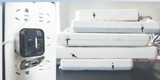
伪装成充电器和插座的针孔摄像装置。