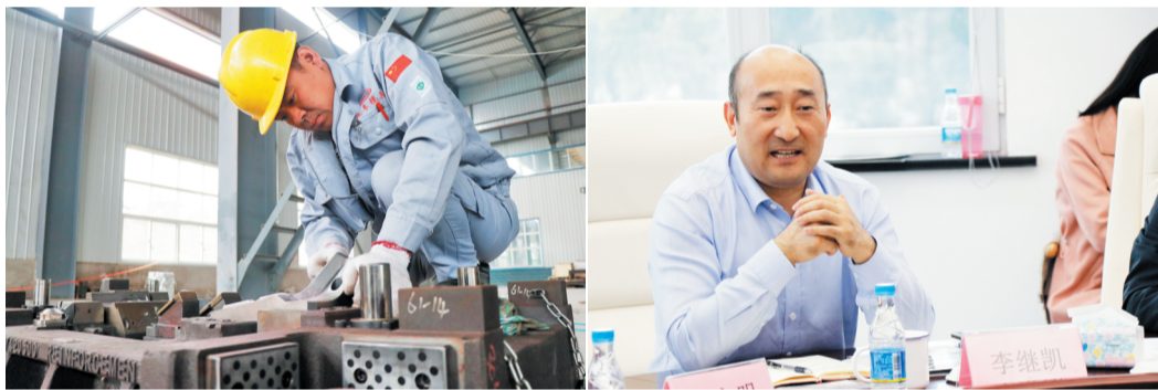
淄博沃德机械科技有限公司的工作人员。