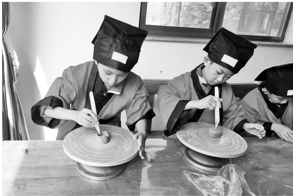
同学们体验陶器的制作过程。

上述12个重点领域中涉及党员干部和监察对象违纪违法问题、违反中央八项规定精神和形式主义、官僚主义突出问题以及工作推进不力问题,请通过以下方式,向区纪委监委举报:监督举报电话:0533-5151606;监督举报邮箱:zcqjwxf@126.com;监督举报网址: http://www.zcjw.gov.cn/