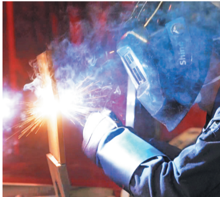
焊工比赛现场,选手们在进行焊接作业。

“党员的权利有哪些?如何深化供给侧改革?新华医疗评选出的工匠都有哪些人……”记者注意到,此次竞赛的试题全部由党史、国史、企业史组成,既是一次知识竞赛,又是一次爱厂、爱国、爱党的教育。经过必答、抢答、风险题的角逐,将现场的气氛不断