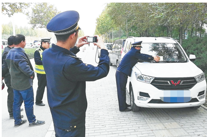
城管执法人员在给《停车记录告知单》。

一步明确执法管理权限,细化工作任务,为下一步城管联合交警查处违停行为打下坚实基础。当天下午,张店区综合行政执法局多个镇办中队联合张店交警,在张店城区内展开拉网式排查整治。