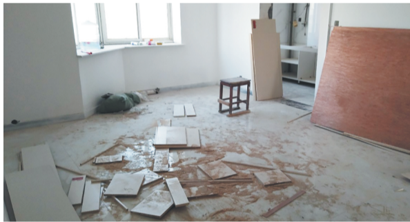
凌乱地散落在客厅内的装修板材。