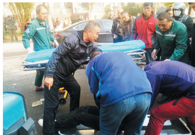
社区工作人员救助受伤的送水工。