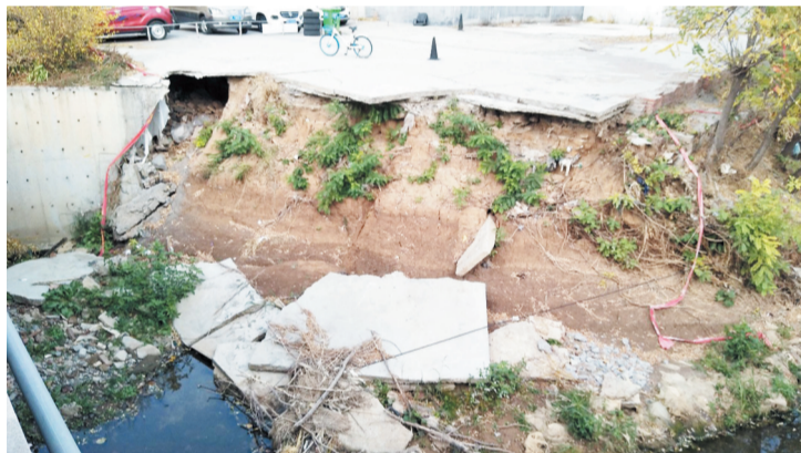
河岸塌陷后的场景。