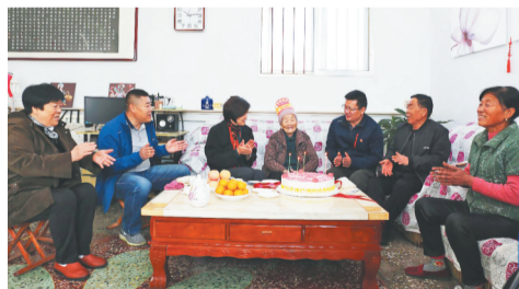
11月14日,第五次活动来到了淄川区岭子镇台头崖村,大家给一位94岁老人唱生日歌。