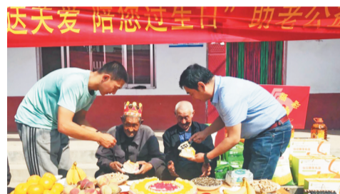
9月26日,第一次活动来到了沂源县南鲁山镇胜家庄村,大家现场为老人们切蛋糕。