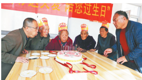
11月12日,第四次活动来到了博山区石马镇响泉村幸福院,大家一起吹蜡烛,给老人过生日。