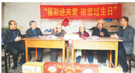
11月7日,第三次活动来到高青县芦湖街道办稻香村,大家陪3位老人过生日。