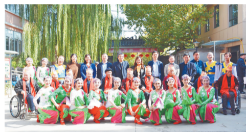
10月31日,第二次活动来到淄川区孟子山老年公寓,大家与寿星们合影留念。