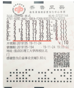
任先生中奖的彩票。

“我们将发动全市民政系统，大力开展关爱残疾人志愿服务活动，积极推动全市残疾人事业发展。”淄博市民政局党组书记、局长许子森在现场表示。