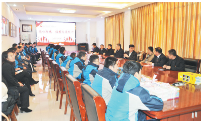
12月2日上午，淄博市特殊教育中心一楼会议室内其乐融融，“爱心助残 福彩与爱同行”活动在这里举行。

文/图 记者 马斌 通讯员 张耀文 王宁 张楠 晨报淄博12月2日讯 12月3日是“国际残疾人日”。今天上午，淄博市福利彩票销售管理中心开展的“爱心助残 福彩与爱同行”活动走进淄博市特殊教育中心，为孩子们赠送图书，征集孩子们的新年微心愿，为残疾儿童少年带去温暖和关爱。