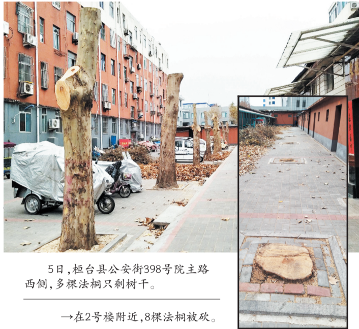
5日,桓台县公安街398号院主路西侧,多棵法桐只剩树干。

对此,物业工作人员表示,对于伐掉的树木目前没有补种计划,因为附近有的居民说要自己绿化。修剪的树木如果死亡,物业会进行补种。