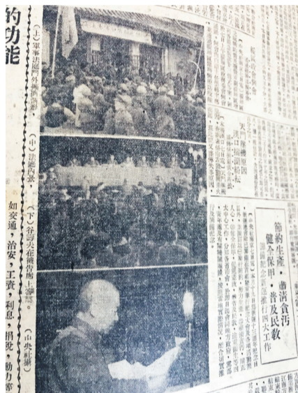
1947年2月8日《申报》上刊发的谷寿夫庭审相关照片。