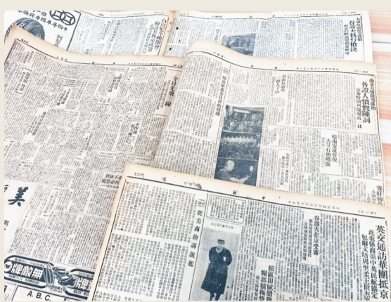
透过泛黄的老报纸,那段历史再现。