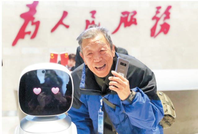
23日,在张店市民中心内,采访团成员与智能机器人“旺宝”合影。

此外,张店市民中心还设置了休闲阅读区、手机充电站、母婴室等便民区域,处处体现着以人为本的服务理念。