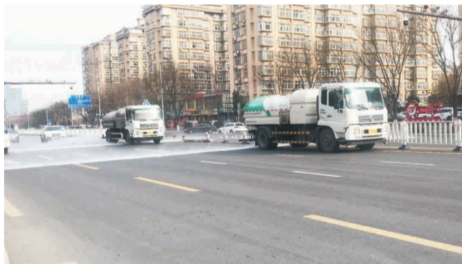
12月19日上午,高新区柳泉路与兰雁大道路口附近,清扫车、洒水车正在清理路面。

记者又来到高新区化工路与电厂西路路口,虽然天气寒冷,但施工人员仍在忙碌着。“此处一直