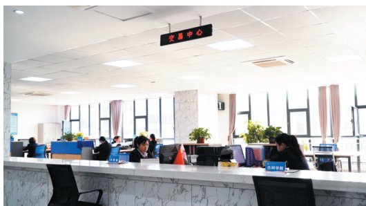
淄川区石灰石交易平台交易中心。