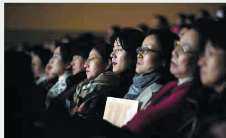
高雅的音乐令现场观众陶醉其中。