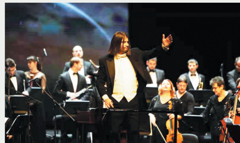
此次新年音乐会由欧美著名指挥大师扬·佩兰特执棒，现场激情洋溢的指挥独具美感，随着乐团将乐谱上的音符转化为打动人心元素，经典曲目又焕发出全新的生命力。