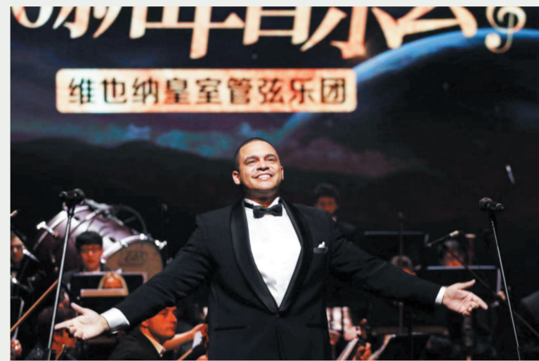
12月30日晚，著名男中音歌唱家菲利普·班德拉克演唱歌剧《塞维利亚的理发师》，活泼的表情和丰富的肢体动作让观众尽情享受音乐的无穷魅力。