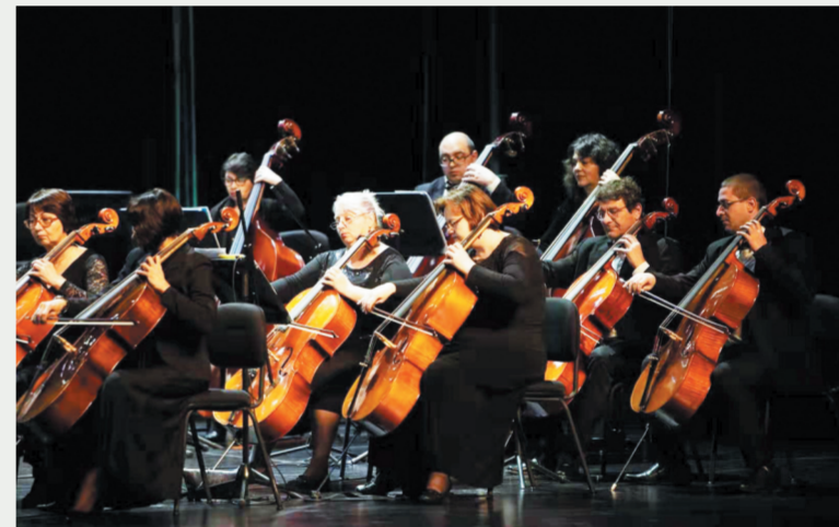
演奏家们专业认真的演奏让现场的听众陶醉其中。据了解，乐团成员均是奥地利各大音乐院团的专业演奏家，乐团秉承维也纳皇家传统艺术，从舞台艺术形象包装到曲风都让人耳目一新。