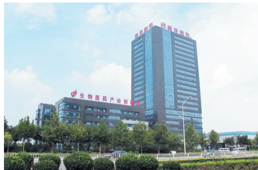
生物医药创新产业园