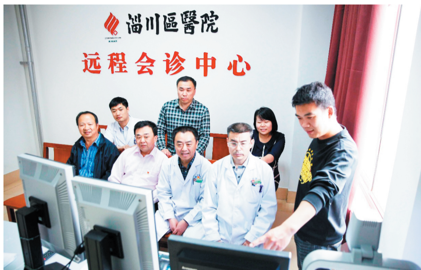
设立远程会诊中心,与上级医院和乡镇医院实现远程会诊。