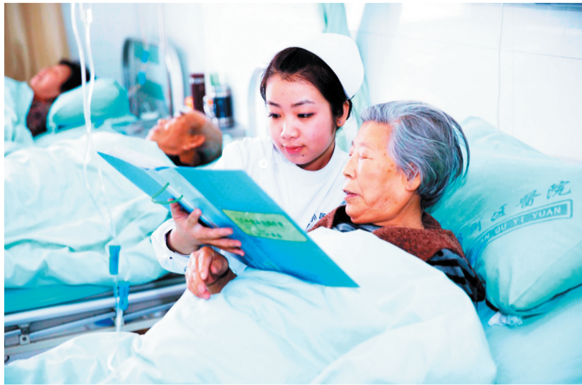
护士为患者进行个性化健康宣教。