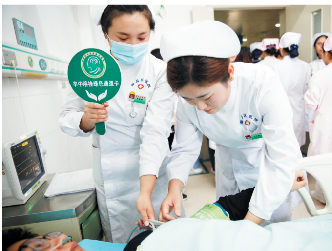
为危急患者提供绿色通道。