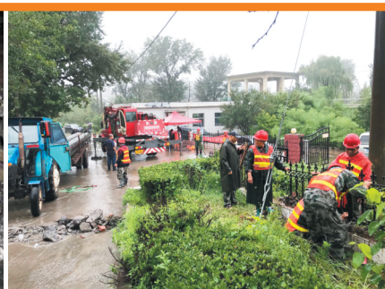
公司抢修人员抗击台风保供水供气。