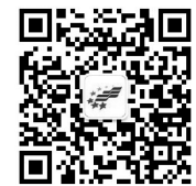
微信交水费更便捷