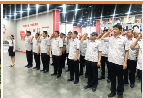
公司的党员赴台头“党章学堂”开展党性体验。