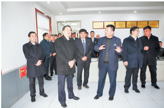
2019年春节前夕,淄川区领导到淄博星辰供水有限公司慰问一线员工。

淄博星辰供水有限公司先后荣获抗击台风抢险救灾先进集体、市供水系统宣传工作先进单位、淄博市先进基层党组织、全国模范职工之家,继续保持了省级服务名牌、省服务标准化示范单位、省守合同重信用企业等荣誉称号。