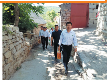
公司相关负责人到帮扶贫困户家中走访。