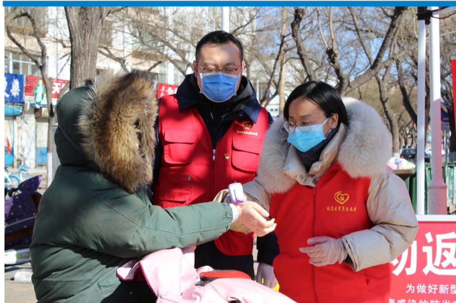
防疫期间,无论白天还是晚上,城西新村社区工作人员和志愿者都认真值守在劝返点,严格防控。