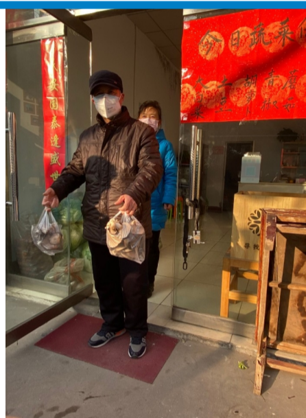
新华社区的“幸福厨房”防疫期间每天给社区居民供应平价新鲜蔬菜。