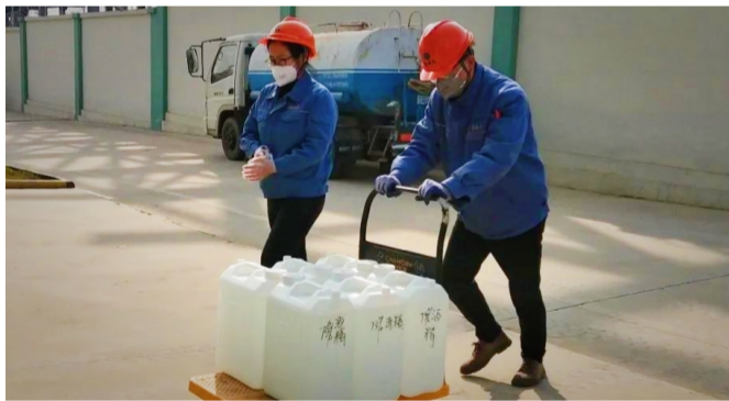
2月26日,员工在搬运消毒液、酒精,用于企业消杀工作。

司是一家化工原料生产企业,主要生产不饱和聚酯树脂、改性树脂、高性能膜材料等,这些新材料应用广泛,如果没有公司生产的新材料,上游企业根本无法正常运转。受疫情影响,订单积压,企业复产复工,迫在眉睫。