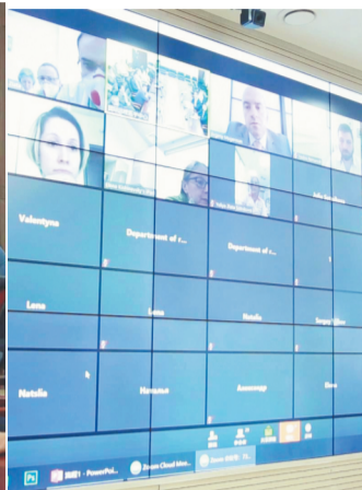
国际友好医院专家与淄博市中心医院专家进行在线交流。