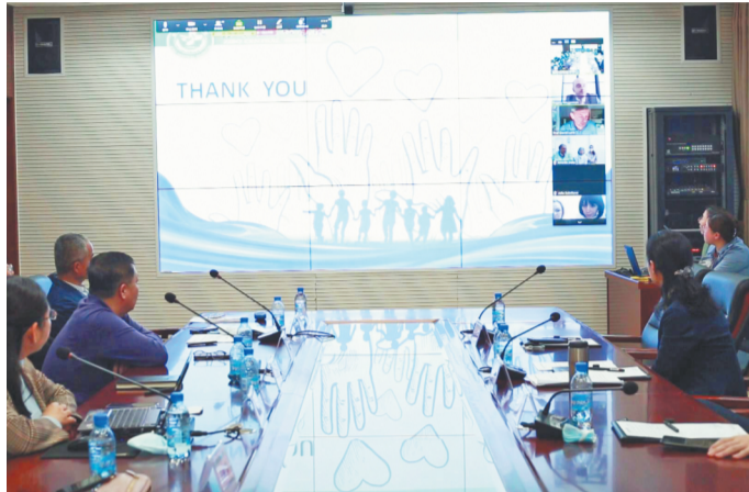
3月25日, 淄博市中心医院专家与国际友好医院专家通过视频会议交流抗击新冠肺炎的相关经验。

随着全球新冠肺炎疫情扩散, 中国秉承人类命运共同体理念, 中国政府已经宣布向80多个国家, 以及世卫组织、非盟等国际和地区组织提供紧急援助, 包括检测试剂、口罩等医疗物资。淄博市中心医院近年来在国际化进程中, 迈出了一大步, 与以色列等国家的医疗机构建立了长期友好合作关系。在疫情防控期间, 以色列的友好医院以不同形式表达了对医