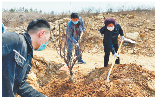
现场,淄博金奥奥迪的员工们三五成群,分工明确。

除了此次公益植树活动外,疫情防控期间,淄博金奥汽车销售服务有限公司还将价值23万元的1万个口罩、500件防护服和500件隔离衣捐赠给淄博市慈善总会,与全市人民一起共克时艰、力抗疫情,用行动履行社会责任。