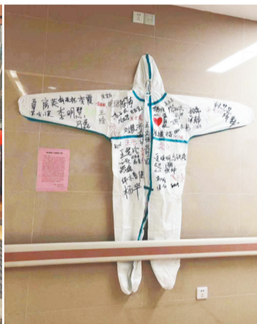
医疗队员在防护服上签名。资料照片