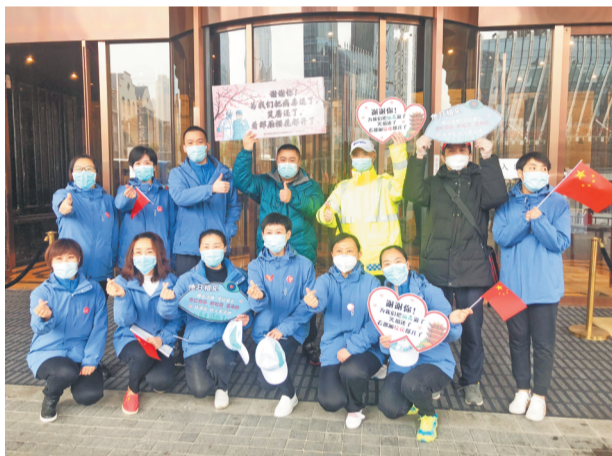
当地志愿者和市民为医疗队员送行。资料照片