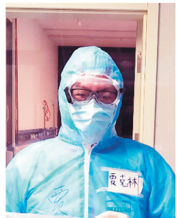
贾克林工作照。