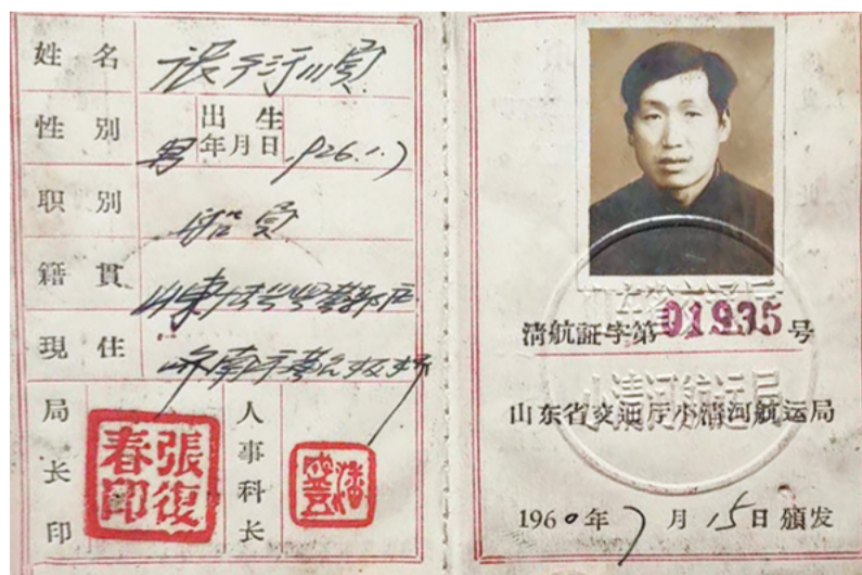
上世纪60年代小清河船员证。