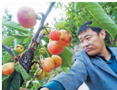
燕崖镇姚南峪村被冰雹砸伤的樱桃。