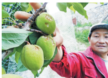
燕崖镇姚南峪村被冰雹砸伤的杏。