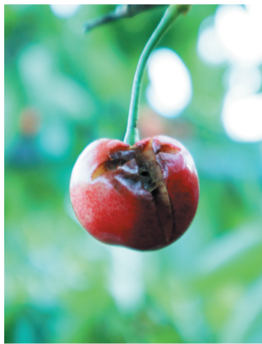
即将采收的樱桃被冰雹砸坏。