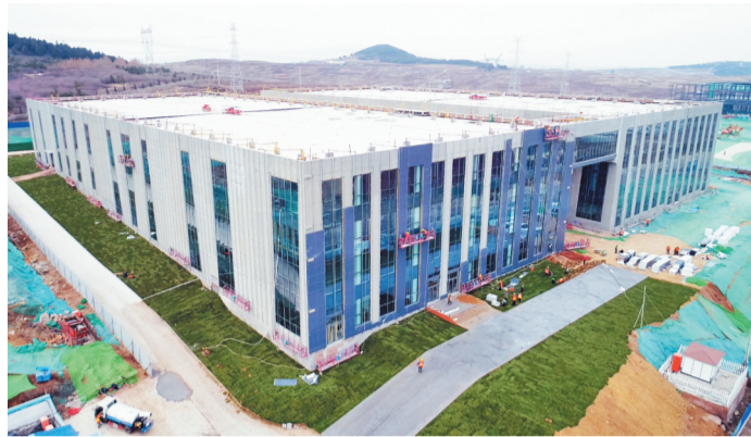
齐鲁激光共享产业园航拍。