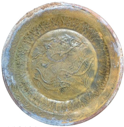
这件茶叶末鱼盘纹饰十分精美。