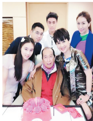
2014年11月25日，何鸿燊93岁生日时与家人合影。