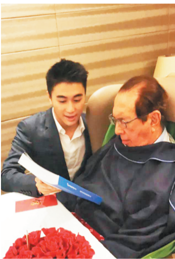
何鸿燊97岁生日当天与儿子何猷君在一起。

赌王一生不赌，更不许家人碰赌。在他看来，幸运的因素从来不应该被考虑，脚踏实地才是可以坚信的致富之路。据《南都周刊》等