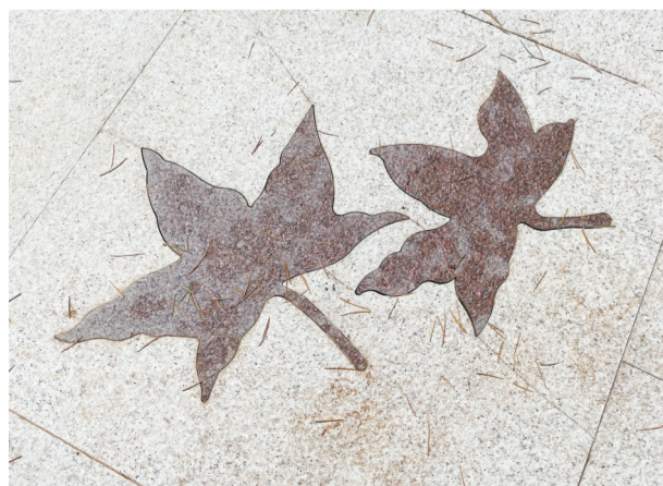
秋日私语 金秋时节,枫叶的红与银杏的黄,与镌刻在地上的扫不走的落叶,构成了一幅秋日私语的画卷。

“我们将突出精心、精细、精致的要求,把品质理念体现到城市规划、建设、管理的每一个细节,不断完善城市功能,提升城市形象,为加快建设务实开放、品质活力、生态和谐的现代化组群式大城市持续发力。”随着淄博市住房和城乡建设局党委书记、局长王瑛的一席话,再望向眼前的美景:河水缓缓流过,沿岸草木焕发勃勃生机,市民在河道一旁的彩色城市步道上慢跑、散步……一幅公园城市美好蓝图的迷你版已绘就完成。