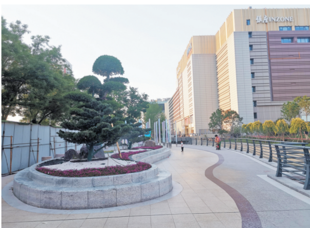
柳泉文化广场 这里有二十四节气智慧互动灯柱,体现现代与传统的完美融合。