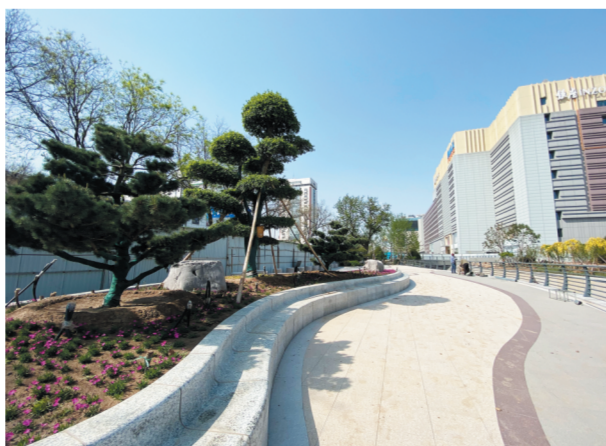
丝路广场 以丝绸的柔美展现广场铺装线条的灵动,不断延伸向远方,体现出淄博开放的胸怀。