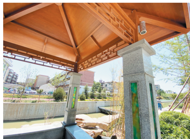
凌波亭 碧波之上,亭台之间,展示着淄博的陶琉文化元素。