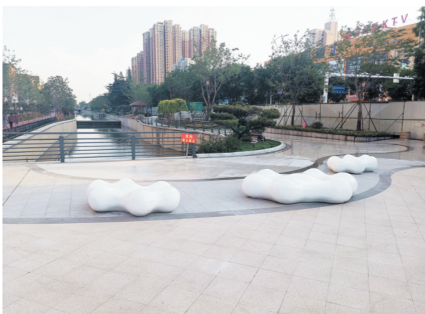
白云广场 白云形状的坐凳与流动的河流构成一幅天地互动的画面,“白云广场”因此得名。