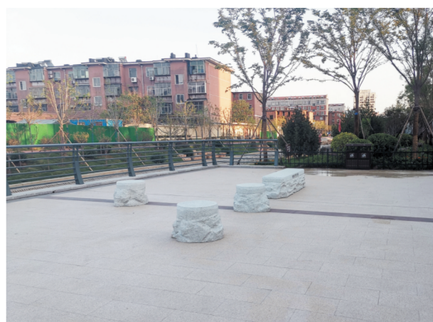
聊斋园 目前正在建设中,即将安放蒲松龄笔下的3只活灵活现的狐狸。