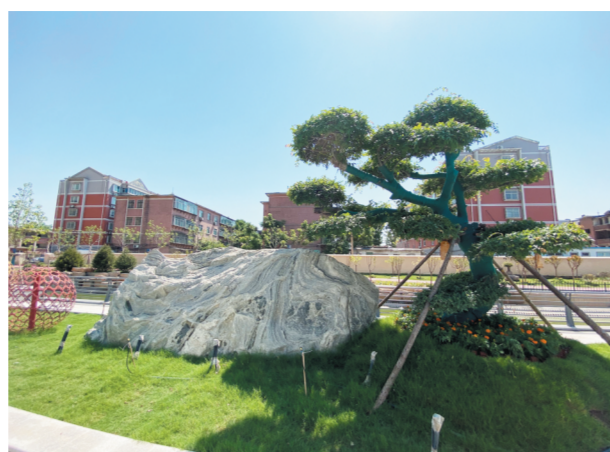
双鱼广场 造型柳榆配合象形石构成一组吉庆有余的画面,象征着“吉庆有余”。