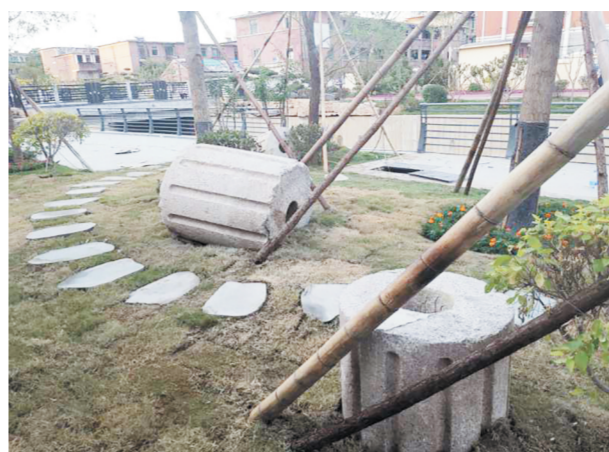
吉祥三宝 大、中、小3个石碾在清理河道时从猪龙河河道挖出,原址恢复历史记忆,寓意构成幸福一家人。