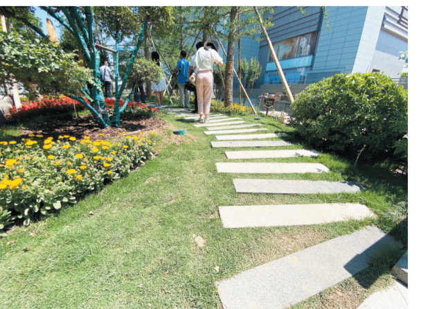
爱情(琴)林 黑白琴键小路曲径通幽,伟岸挺拔的银杏树与婆娑起舞的金叶榆两两相望,讲述一个浪漫唯美的爱情故事。