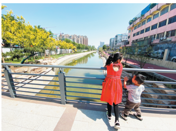
蒲公英广场 原猪龙河上就有蒲公英广场,保留历史记忆,继续使用,并打造为孩童可游玩、成人可落座的休闲场所,提升城市功能,增强便民服务性。