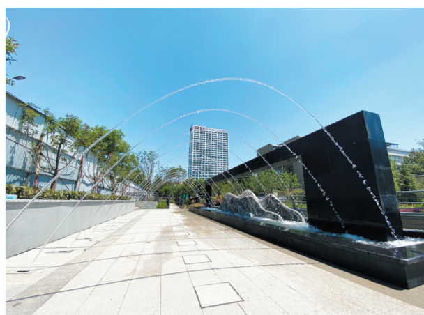
山水世界 体现淄博南山水北的文化,结合现代科技打造一处儿童戏水平台。