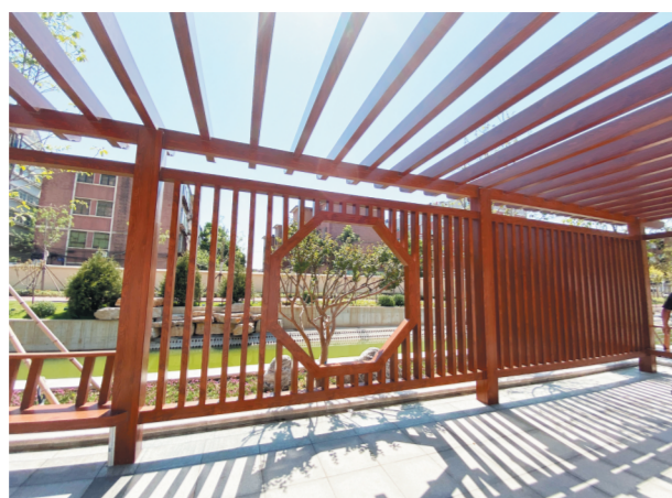
知春亭 顾名思义,知春亭是最早望见春天的地方,在这里,可以“推窗见景、出门如画”。