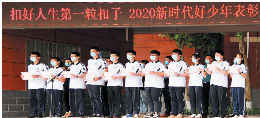
淄川中学2020年“新时代好少年”表彰现场。