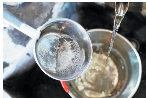
酒花越大,代表着流出的原酒度数越高。