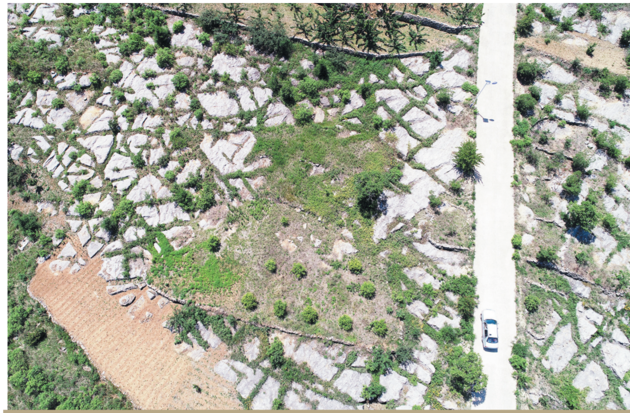
村旁山上,有大片裸露出的山石,形成浩瀚的石海。