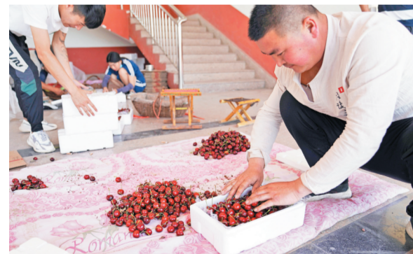
在村内的樱桃收购点,一名商贩正在整理村民刚送来的樱桃。