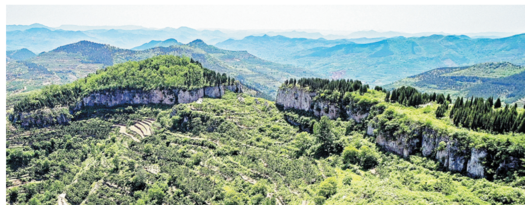
传说二郎神挑山至此,扁担断裂后将山砸成了两半。