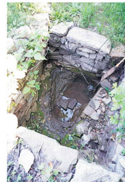
一方一圆两个泉眼,互相陪伴,双泉村也因泉得名。