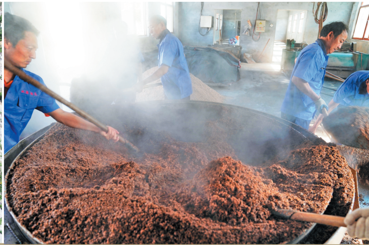
蒸完酒,工人们合力将酒糟从罐子中清理出来,下次酿酒这些酒糟还用得着。