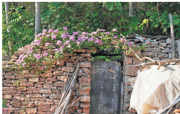
一户村民破旧的院门被盛开的鲜花装点得热烈而又温馨。