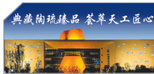
典藏陶琉珍品 荟萃天工匠心 主办：中国陶瓷琉璃馆 电话：2167708 地址：淄博市文化中心