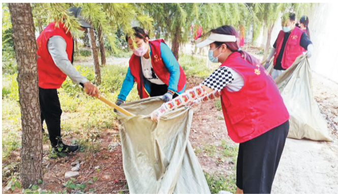
志愿者们正在捡拾绿化带内的垃圾。

在环保志愿服务活动中，志愿者遇到乱扔垃圾、乱停车辆、占道经营等不文明行为，会及时上前劝导制止，在劝导过程中，只要看到地上的垃圾杂物随手捡起、牛皮癣小广告，随手撕掉。广大志愿者通过实际行动呼吁更多人加入环保队伍中，共同倡导“绿色社区、文明你我”的环保理念，构建和谐美丽社区，助力文明城市创建。