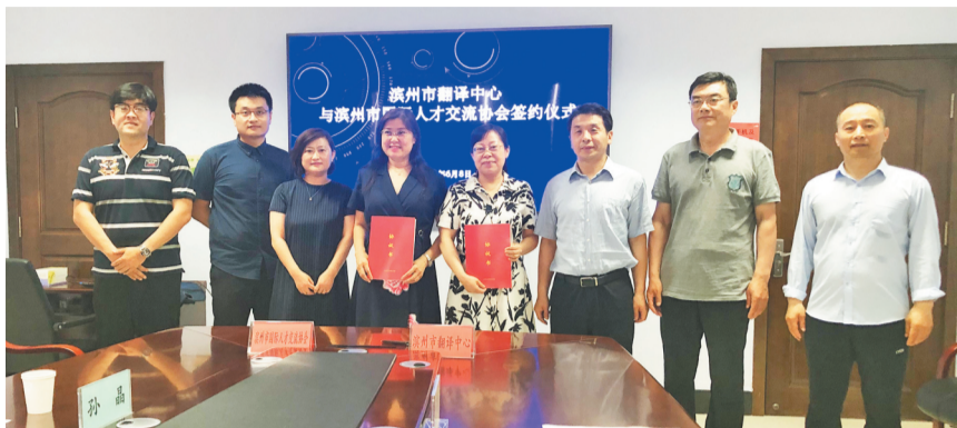
滨州市翻译中心与滨州市国际人才交流协会工作人员签约后合影留念。

记者 张贵英 通讯员 顾英子 报道 晨报滨州6月9日讯 6月8日下午，滨州市翻译中心与滨州市国际人才交流协会签订战略合作框架协议，双方将优势互补，更好协同发展。签订战略合作框架协议后，双方将在滨州市范围内共建“一带一路国际语言中心”，开展生活外语短期培训、商务外语短期培训、语言考试短期培训，为企