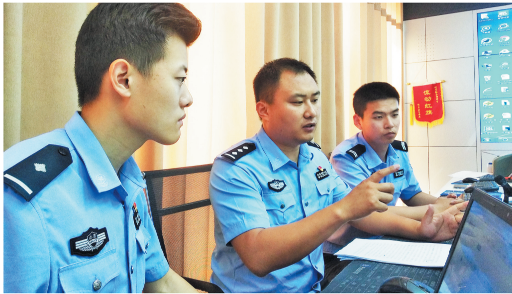
民警在切磋警务大数据分析方法。

“谁失去平台使用权，谁就丧失警务指挥权，谁就丧失未来工作的主动权。”对于大数据应用的重要性，桓台县副县长、县公安局局长孙敬双如是说。他告诉记者，通过利用最新的数字信息技术，打破信息壁垒，唤醒“沉睡”数据，可以为城市治理把握规律、研判趋势、突出重点、攻坚克难提供重要依据，可以更好地服务公安工作，服务各级党委、政府的科学决策。