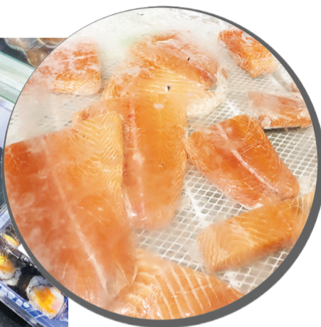
6月14日,淄博银座商城中心店地下超市内,未上架三文鱼及相关产品。