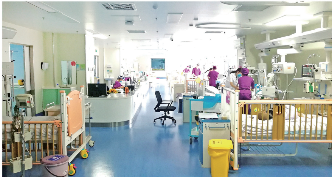
淄博市妇幼保健院儿童重症监护病房（PICU）内部环境。