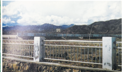
援建的昂仁县体育场。资料照片(2000年摄)