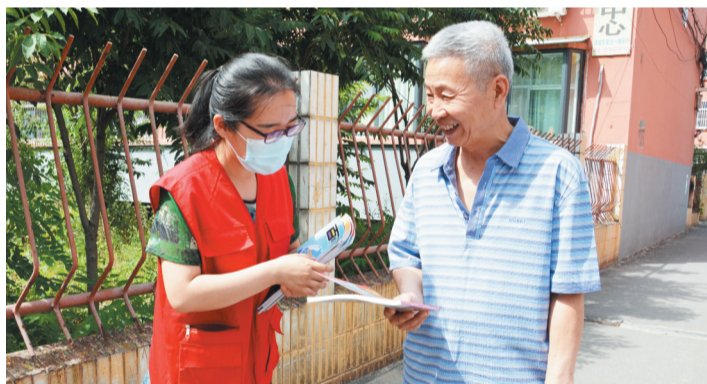
工作人员向市民派发宣传单。

书馆总分馆的身份证明押金借书服务展开。淄川区所有身份证明押金读者的失信信息将全部纳入中国人民银行征信系统,与纳税、归还银行贷款一样,读者的图书借书行为也可以产生信用记录,其不良信息将由人行征信服务平台进行数据采集,且至少保留五