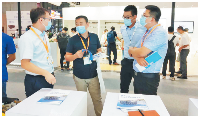
淄川区招商局工作人员向参会客商推介齐鲁激光共享产业园。

文/图 记者 蒲法奇 通讯员 莫燕娜 晨报淄博7月6日讯 7月2日-5日,淄川区招商局联合锐嘉科专业团队组成招商联合体,围绕“六个一”平台招引工作新机制,进一步强化产业链招商,以齐鲁激光共享产业园为招引载体,在慕尼黑(上海)光博会上与