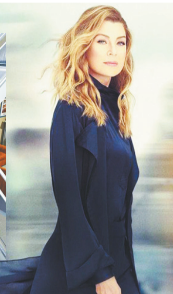
▲《实习医生格蕾》海报。

或者成为名模，而是努力想要用实力证明自身的实力。大学时她的成绩总是名列前茅，在医院实习时也十分优秀。但豪斯一开始认为她并不是所有人中最优秀的，仅仅是因为卡梅伦“长得十分漂亮，就好像在客厅里挂一幅好的艺术品”才雇佣她。为了能够让豪斯改变对自己的看法，卡梅伦付出了比其他男性医生更多的努力。最终豪斯改变了对卡梅伦的看法，她也成为豪斯医生团队中必不可少的一员。