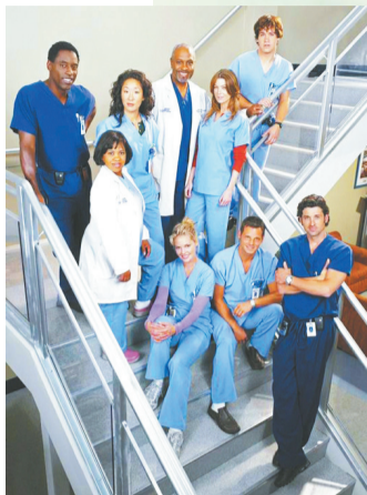
▲《实习医生格蕾》剧照。