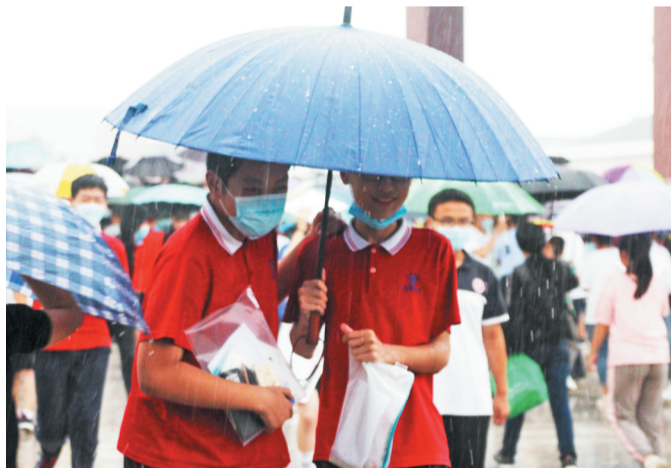
7月13日，在淄博高新区实验中学考点，两名初四考生结伴撑伞走出考场。