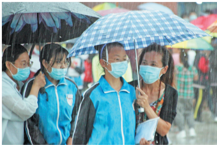
7月13日，在淄博高新区实验中学考点，雨越下越大，家长为走出考场的初四考生撑起雨伞。

考试结束，接下来最让考生和家长们关注的就是分数和志愿填报了。今年，淄博市高中阶段学校志愿填报采取网上填报的方式，分两次进行，首次志愿填报时间为7月31日-8月1日，征集志愿填报时间为8月7日。两次志愿填报均设置三类：“3+4”对口贯通培养高职本科和高等师范教育类志愿设置一个；普通高中类志愿设置一个指标生志愿和三个非指标生志愿，非指标生志愿为平行志愿；初中后职业教育类（不含“3+4”对口贯通培养高职本科和高等师范教育类）学校设置两个平行志愿，每所志愿学校选报专业设置两个平行志愿。志愿填报须由考生本人自行登录淄博市中考招生管理平台（ http://zkzs.zbedu.net/ ），根据本人意愿，按照报考条件填报志愿。志愿填报结束后，任何人不得随意改动。选报初中后职业教育类学校志愿的考生，须填写专业是否服从调剂。