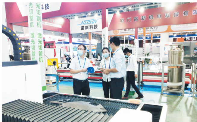
淄川区招商局工作人员向参展的激光企业推介齐鲁激光共享产业园。

厦门工博会(台交会)是海峡两岸工业领域规模最大、影响最广的品牌展会,涵盖了智能制造(工业机器人和自动化)、机床及激光设备、工模具及功能部件、工程机械等众多