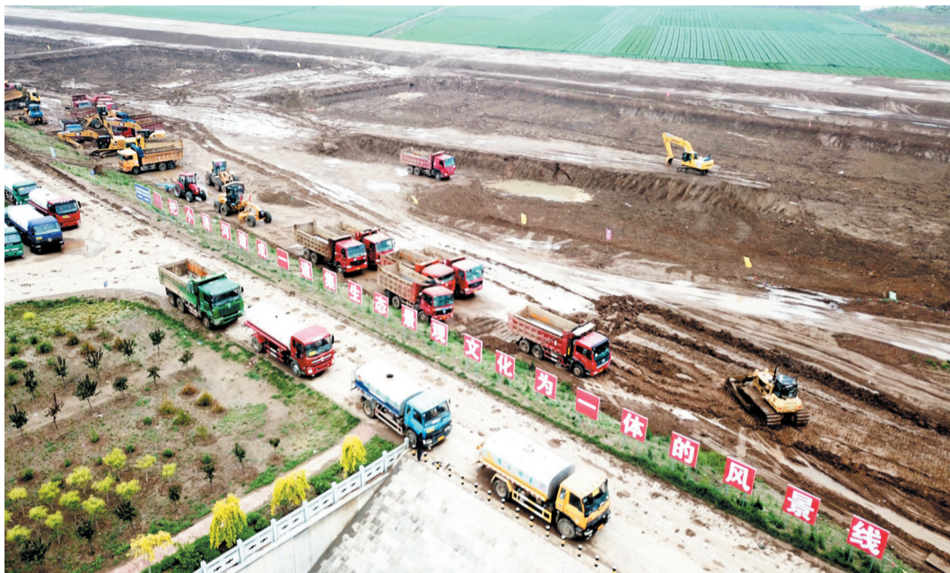
位于高青的小清河复航工程全家堰船闸施工现场。

S228黄临线淄博滨州界至郑王段改建工程。2020年计划实施剩余6.8公里,截至目前,石