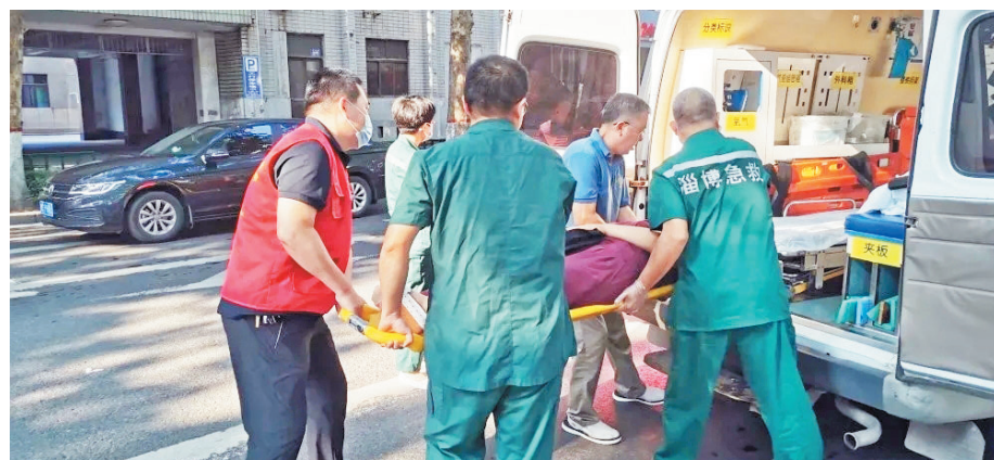
志愿者帮助医护人员把伤者抬上救护车。