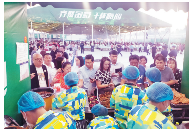
临淄特色美食引得众多市民品尝购买。