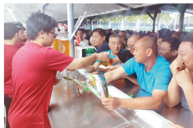
临淄会场,市民抢购新鲜的啤酒。

本届啤酒节,淄博市新媒体联盟还组织开展了网络名人助力啤酒节主题宣传活动。开幕式上来自省内外的近20位网络名人,现场领略了啤酒节的时尚、活力、品质内涵。