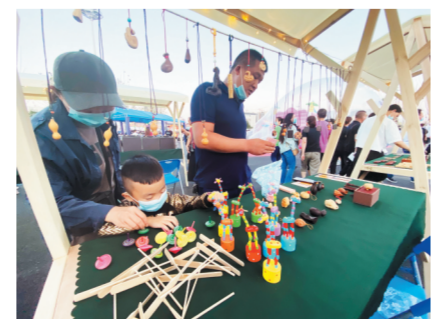
月光集市文创产品吸引市民驻足。