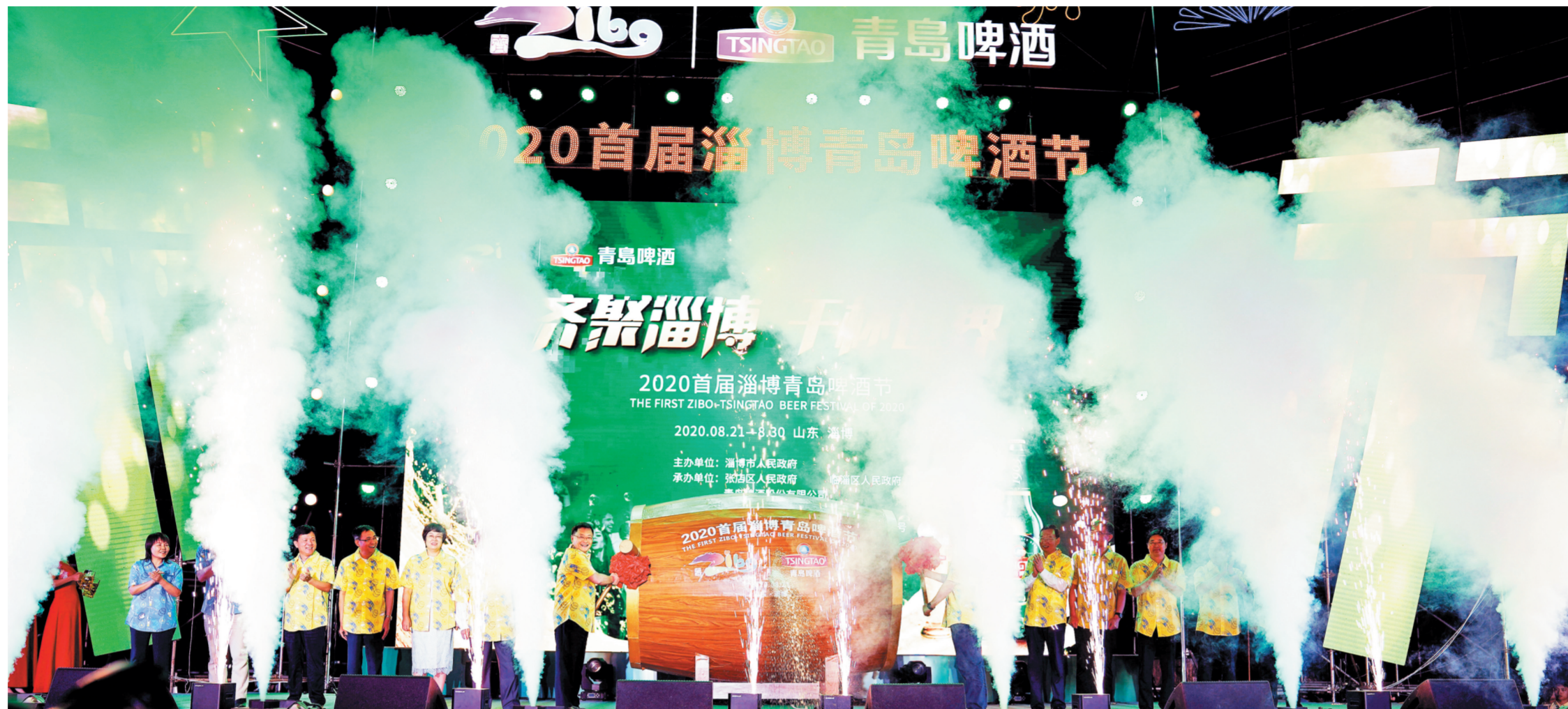
2020首届淄博青岛啤酒节第一桶啤酒开启。

本版文/图 记者 王兵 王莉莉 王兆杰 宫瑞瑞 高阳 见习记者 张震 (单独署名除外)