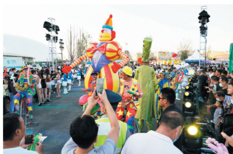
啤酒城内,巡游队伍与市民亲密互动。