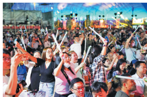
啤酒节现场气氛热烈,市民积极参与互动。