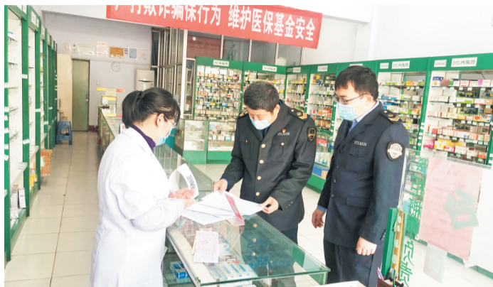
4月1日,淄博市市场监管局、张店区市场监管局执法人员联合对药店进行监督检查。 资料照片

淄博这份“不罚清单”“减罚清单”可谓“对症下药”,极富“淄博特色”。记者梳理清单发现,发展改革领域不罚清单4项;工业和信息化系统不罚清单2项;财政系统不罚清单3项;人力资源和社会保障局不罚清单10项、减罚清单10项;自然资源局不罚清单21项;生态环境系统不罚清单15项、减罚清单1项;住房和城乡建设系统不罚清单141项;水利系统不罚清单9项、减罚清单2项;农业农村系统不罚清单15项;审计系统不罚清单1项;市场监管系统不罚清单41项;体育系统不罚清单4项;统计系统不罚清单2项;医疗保障局不罚清单6项、减罚清单2